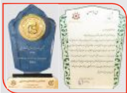
♦ صفحه ۳