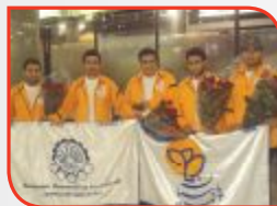
♦ صفحه ۲