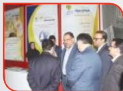
♦ صفحه ۸